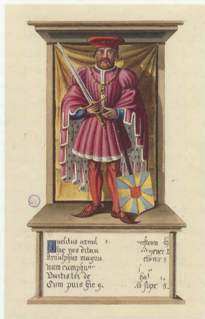
13 | Tekening van het grafschrift van Arnulf II, Alexandre Pinchart, 19de eeuw