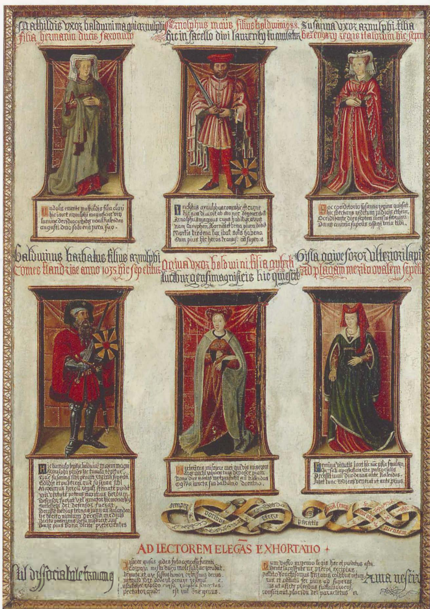
12 | Schilderij met voorstelling van de graven van Vlaanderen die in de Sint-Laurentius-kapel waren begraven, late 15de of begin 16de eeuw (Stad Gent, STAM, Bijlokecollectie)

Niettegenstaande de eenstemmigheid van de bronnen van de 14de tot de 16de eeuw, stellen de erin aangeduide graven toch diverse problemen, niet in het minst omwille van de toch wel grote tijdsafstand tussen het overlijden van de betrokken personen (van 918 tot ca. 1058) en de eerste vermelding van hun graf in de twee kapellen (rond 1380). Een eerste vraag die men zich daarom moet stellen is of al deze personen wel in de Sint-Pietersabdij begraven werden. Voor de meeste onder hen is er geen enkele reden tot twijfel. In sommige gevallen is zelfs eigentijds, of nagenoeg eigentijds (10de-11de eeuw), bronnenmateriaal voorhanden (Boudewijn 11, Elftrudis, Arnulf 1, Adela). Een probleem is er wel bij twee vrouwelijke