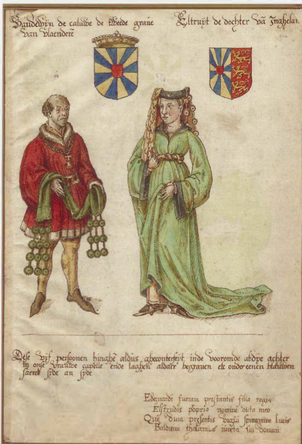
1 | Graaf Boudewijn II en gravin Elftrudis, tekening Arent van Wijnendale, ca. 1560 (Stad Gent, Stadsarchief)

betreft 12 | 2 |. Op basis van het schrifttype gebruikt voor de opschriften kan het in de late 15de of de vroege 16de eeuw gedateerd worden. Tot slot komt de begraafplaats van de meeste leden van de grafelijke familie in één van beide kapellen ook aan bod in de historiografie uit de late 15de en de eerste helft van de 16de eeuw. Adriaan de But, een cisterciënzer van de abdij Ten Duinen, neemt in zijn Chronicon Flandriae , geschreven tussen 1460 en 1488, voor tien van de elf betrokken personen het grafschrift op en geeft bij drie van hen (Susanna, Gisla en Odgiva) uitdrukkelijk aan dat ze in de Sint-Laurentiuskapel begraven liggen. Het laat 15de-eeuwse Chronicon Sancti Bavonis van zijn kant biedt verhoudingsgewijs maar weinig gegevens ter zake. Het situeert enkel het graf van Arnulf I en zijn dochter Lutgarde in de Onze-Lieve-Vrouwekapel. Minder karig met informatie is dan weer de West-Vlaamse humanist Jacob de Meyere, die in twee verschillende werken samen, op één uitzondering na, alle graven precies lokaliseert: zes graven in zijn Rerum Flandricarum tomi X uit 1531 (Arnulf I, Adela en Lutgarde in de Onze-Lieve-Vrouwekapel, Boudewijn IV, Odgiva en Gisla in de Sint-Laurentiuskapel), nogmaals zes in zijn Compendium chronicorum Flandriae gepubliceerd in 1538 (Boudewijn II, Elftrudis, Adela en Lutgarde in de Onze-Lieve-Vrouwekapel, Arnulf II en Susanna in de Sint-Laurentiuskapel).