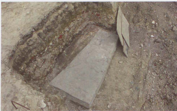
|| Boven graf S140 in de westelijke travee van de monnikenkerk werd een anepigrafe grafplaat opgegraven

De toch wel waarschijnlijke hypothese van de verplaatsing roept natuurlijk nieuwe vragen op. De voornaamste is of de graven voordien al gegroepeerd waren,