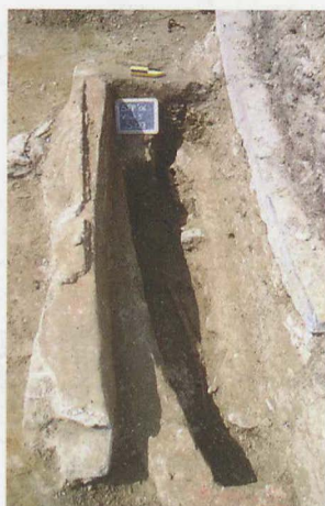
| 7 | Graf s150 met een man van ongeveer 25 jaar uit de 9de eeuw, opgegraven in de westelijke travee van de monnikenkerk | 9 | Graf s127 met een dame van 45-50 jaar, opgegraven in de westelijke travee van de monnikenkerk

milde weldoener, of misschien eerder een lekenabt die tot een grote aristocratische familie uit de regio behoorde. Het feit dat zijn graf het eerste was dat op deze plaats werd aangelegd, is op zich al revelerend. In de 9de-eeuwse abtenlijst van Sint-Pieters is er eigenlijk maar één figuur die in aanmerking zou kunnen komen, namelijk Audacer | 8 |. Van hem is bekend dat hij de vader was van graaf Boudewijn I, de stamvader van de graven van Vlaanderen, en in die hoedanigheid zal hij vanaf de 11de-12de eeuw in de Vlaamse historiografie een eigen leven gaan leiden als één van de legendarische forestiers van Vlaanderen. Over het historische personage weten we verder enkel dat hij eveneens graaf was en ook lekenabt van Sint-Pieters. In een schenkingsaantekening uit 856, die genoteerd staat in de 11de-eeuwse kloosterannalen, werd hij immers aangeduid als abbas vel comes 22 . Aangezien zijn zoon Boudewijn I na 863 en voor 870 op zijn beurt het lekenabbatuaat van Sint-Pieters verwierf, moet Audacer omstreeks 860 overleden zijn. Dit zou in overeenstemming zijn met de gekalibreerde C14-datering.