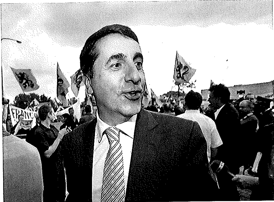
Maingain is een plaaggeest en een geboren provocateur. Hij weet precies hoe hij Vlamingen op de kast moet jagen.

'Louis Michel is iemand van de generatie van Jean-Luc Dehaene, die ervan doordrongen is dat permanent overleg met de andere gemeenschap het wezen van de