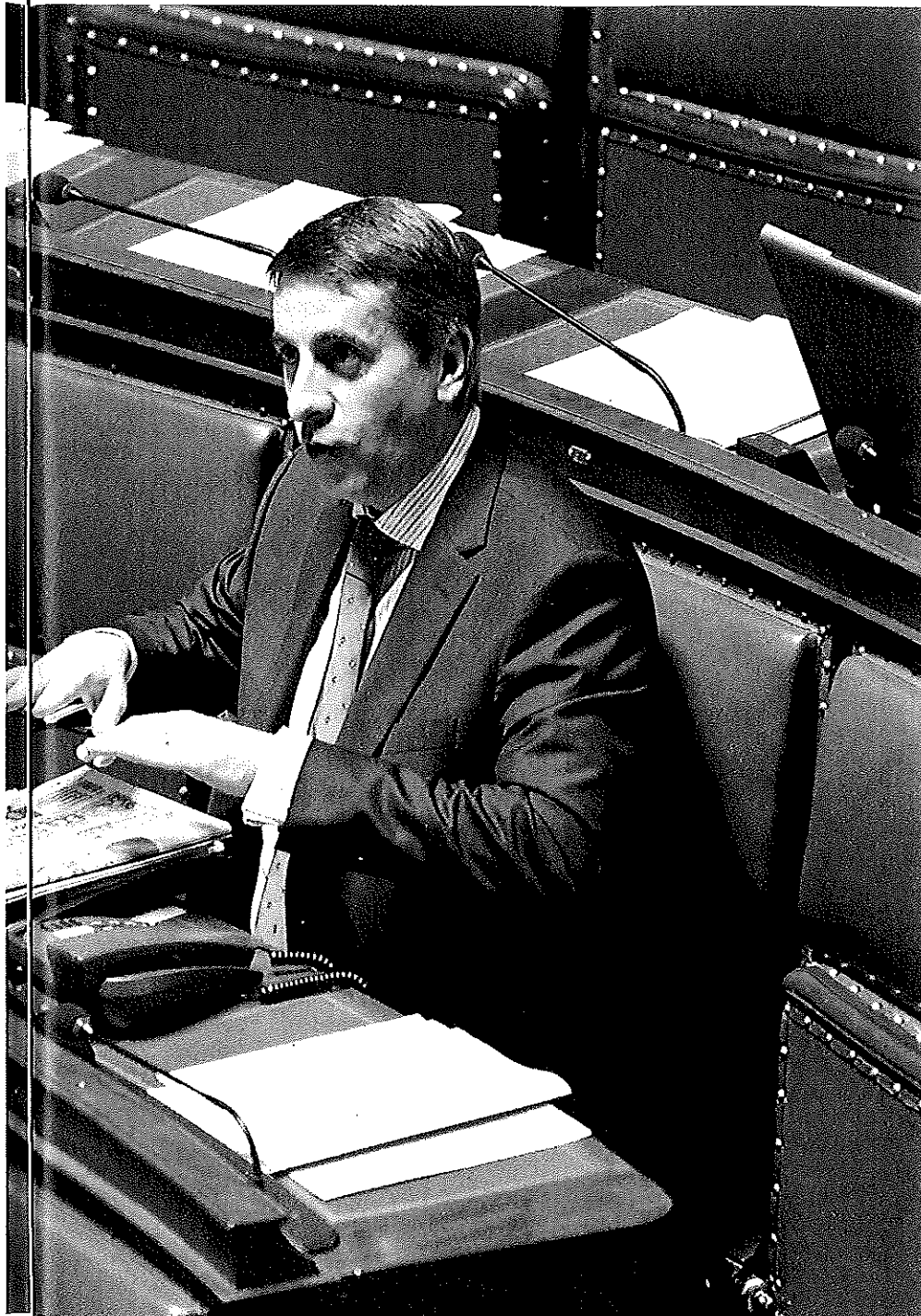
OLIVIER MAINGAIN (MET DIDIER REYNDERS)

Een vechtersbaas, zij het een in maatpak, die er niet voor terugschrikt om Reynders politiek te chanteren.