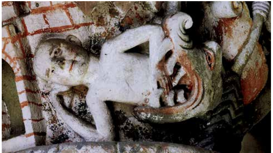
22 - Jonas et la baleine (dét.). Mozac (Puy-de-Dôme). Ancienne abbatale Saint-Pierre. Nef. (D'après J.-M. et M. Perona, Trésors de Mozac. Sculptures romanes , Mozac, 2012, p. 61).

l'infini » 35 . Il n'est pas étonnant dès lors, qu'on ait cru que la mer contenait exactement les mêmes êtres que la terre, mais adaptés à leur milieu. Et il était inévitable que l'art et la littérature du Moyen Âge soient imprégnées par ce qui n'était sans doute pas un concept structuré, mais une idée sous-jacente à la théologie et à la cosmographie de l'époque, au confluent de plusieurs cultures.