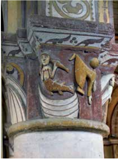
7 - Sirène éjectant un homme de son embarcation. Civaux (Vienne). Saint-Gervais-et-Saint-Protais, nef, côté nord. (D'après Sirènes m'étaient contées , Bruxelles, 1992, p. 87).