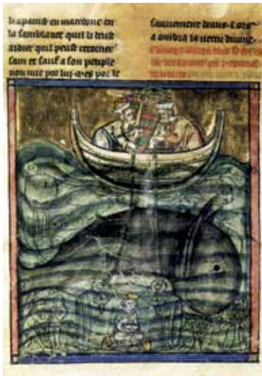
21 - L'aventure marine d'Alexandre. Bruxelles, Bibliothèque royale de Belgique, ms. 11040, fol. 70v (Reims?, fin du XIII e siècle). (D'après J. Toussaint dir., Fabuleuses histoires. Des bêtes et des hommes , Namur, p. 56).