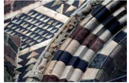
17 - Deux monstres ichtyomorphes. Le Monastier-sur-Gazeille (Haute-Loire). Ancienne abbatale Saint-Chaffre. Façade, fenêtre centrale. (© Bernard Galland, Augeac).