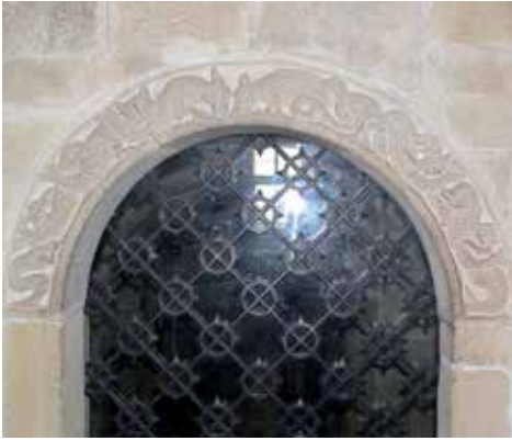
15 - Série de poissons et d'hybrides marins. Archivolt. Pavie, Museo civico..