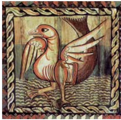
13 - Oiseau ichtyomorphe. Plafond peint (c. 1180). Saint-Martin de Zillis (Rhétie). (D'après E. Murbach, Zillis. Images de l'univers roman , F. IX 14).