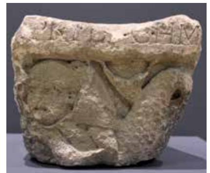
19 - Moine marin. Fragment de chapiteau (Rhénanie, avant 1200). Coblenz, Musée du Rhin moyen. (© Mittelrhein-Museum Koblenz).

Bien qu'ils soient moins spectaculaires que les plafonds peints, plusieurs ensembles sculptés – notamment à Pavie (Lombardie) (ill. 15) – comprennent aussi des contreparties marines. Peut-être doit-on mettre ces choix iconographiques en rapport avec d'anciennes traditions d'origine germaniques? Comme on sait, dans haut Moyen Âge, Pavie fut la capitale des Lombards. Pour ce qui est de la sculpture du baptistère de Parme (Émilie) 30 (ill. 16) ou celle de la façade de l'ancienne abbatale du Monastier-sur-Gazeille (Haute-Loire) (ill. 17), c'est moins évident, quoique l'Émilie et le Velay connurent plusieurs épisodes plus ou moins longs d'occupation germanique. En tout cas, c'est en Germanie en sens large que les contreparties marines seront le plus souvent figurées dans le bas Moyen Âge, et même avant, dans et hors bestiaires (ill. 18).