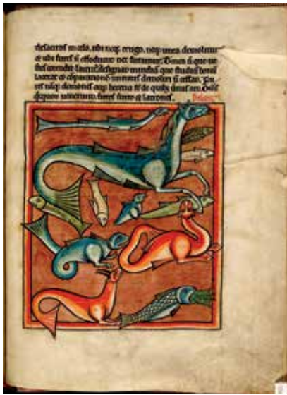
11 - Frontispice du chapitre Piscez. Bestiaire (Angleterre, c. 1230-1240). Londres, British Library, Harley 4751, fol. 68r.