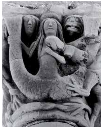
9 - Sirène allaitant son petit. Serrapio (Asturies), Saint-Vincent, arc triomphal. (D'après P. Docampo Álvarez, J. Martínez et J.A. Villar Vidal, Animales fabulos del Románico en Asturias , Gijón, 2000, p. 191, fig. 115).