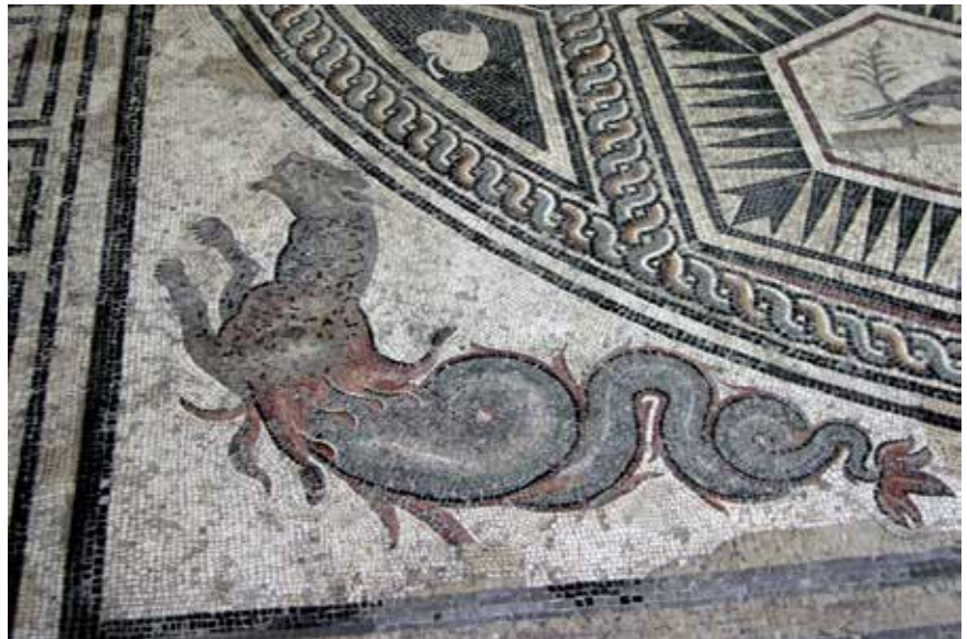
2 - Panthère marine. Mosaïque du Paon, détail d'un des angles (70-80 apr. J.-C.). Vaison-la-Romaine (Vaucluse). Musée Théo Desplans.

Dans ce cas, quoiqu'ils soient généralement figurés de manière assez réaliste, les poissons sont uniformément répartis sur la surface sans qu'il y ait le moindre chevauchement, selon le principe abstrait très caractéristique des mosaïques de la Basse antiquité, selon lequel une totale visibilité prime sur des relations spatiales justes. Ce qui frappe également dans ce genre de décors est l'aspect extraordinairement varié de la faune marine qui s'y déploie, ce qui leur confère l'allure de véritables catalogues de poissons, crustacés et mollusques. On les trouve partout en Italie, en Gaule et dans la péninsule ibérique mais ils sont particulièrement caractéristiques des mosaïques de thermes et des demeures cossues d'Afrique du nord dans lesquelles, figurées dans le triclinium , ils faisaient allusion à l'abondance de nourriture servie dans la domus 2 . À l'évidence, les artisans ont pris plaisir à représenter ces poissons et autres crustacés qui constituaient des mets de choix ainsi qu'une source de revenus importante. Nous verrons bientôt qu'on ne trouve guère l'équivalent dans l'art romain, à l'une ou l'autre exception près, même en bord de mer.