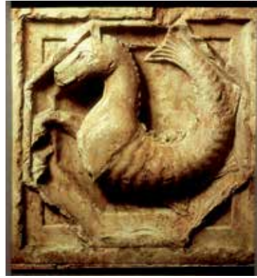
16 - Cheval marin. Parme (Émilie). Baptistère, relief extérieur. (D'après G. Duby, G. Romano et Ch. Frugoni, Battistero di Parma , Milan, t. 1, 1992, fig. 64).