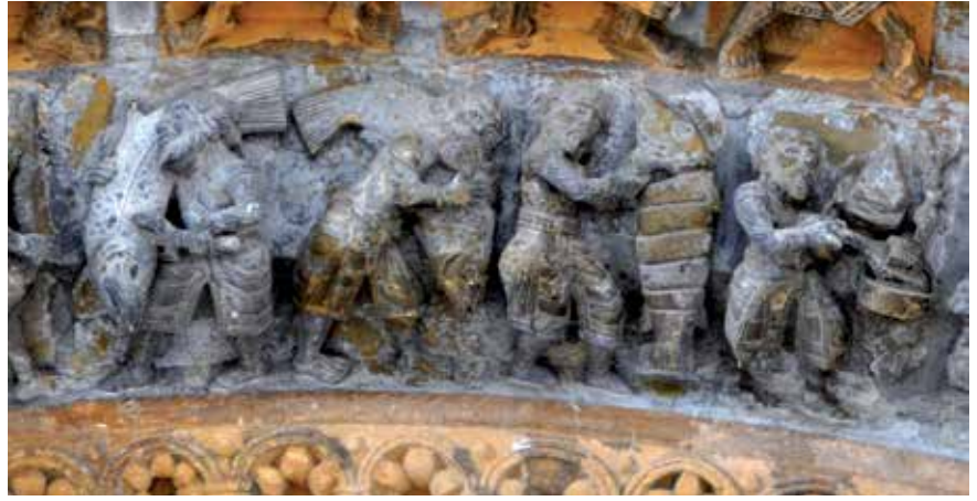
6 - Retour de la pêche, découpage et salaison d'un poisson. Oloron-Sainte-Marie (Pyrénées atlantiques). Porche, portail.

dispose pas de témoignages iconographiques correspondants qui illustreraient ces dires. En effet, les rares bipèdes ichtyomorphes éventuellement ailés, comme celui qui est peint au fol. 124r du Psautier de Stuttgart (ill. 4), dérivent aussi de prototypes romains. Pour le reste, à ma connaissance, les seules créatures marines qu'on trouve dans l'art carolingien sont, outre l'un ou l'autre poisson symbolique sculpté sur de rares chapiteaux 10 , celles qui figurent comme attribut des personnifications de la Mer, opposées à celles de la Terre sur les ivoires et dans la miniature – suivant la tradition antique également – sans oublier le signe zodiacal des Poissons, peu intéressant pour notre propos.