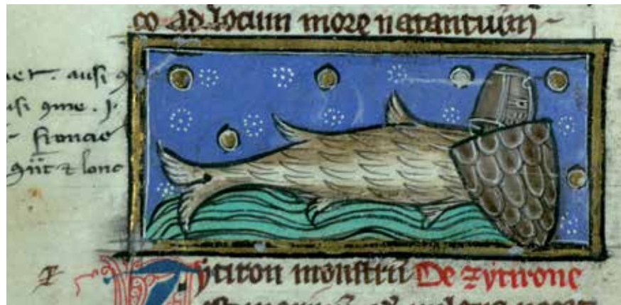
20 - Zytiron en poisson-chevalier. Thomas de Cantimpré, De natura rerum. Valenciennes, Bibliothèque municipale, ms 320, fol. 120v.