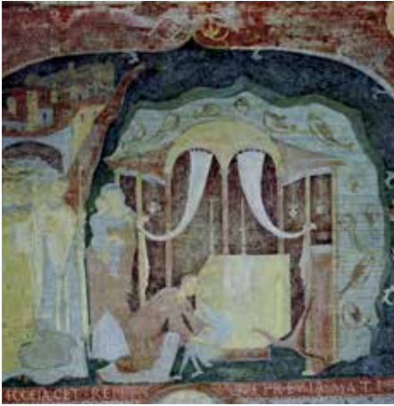
5 - Le miracle de la Mer noire. Rome, Saint-Clément, église basse, c. 1100. (D'après O. Demus, La peinture murale romane , Paris, 1970, pl. XVII).