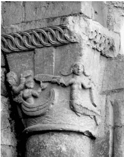
8 - Sirène offrant un poisson aux occupants d'une barque. Priorale Notre-Dame de Cunault (Maine-et-Loire). Portail Nord.