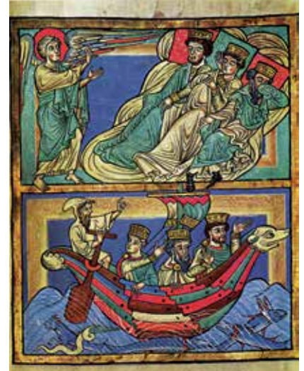
18 - Le songe et le voyage des Rois mages. Évangélistaire de la cathédrale de Spire (Rhin moyen, fin du XII e s.). Karlsruhe, cod. Bruchs I, fol. 13r. (D'après H. Fillitz, Das Mittelalter I., Berlin, pl. LXIV).