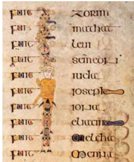
3 - Femme-poisson. Livre de Kells (Iona et Kells, fin du VIII e s.). Dublin, Trinity College Library, ms 58, fol. 213r. (© The Board of Trinity College Dublin).