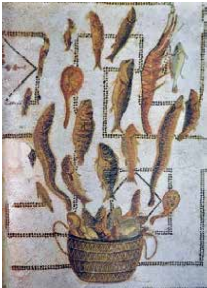
1 - Vase aux poissons. Mosaïque provenant de l'antique Hadrumète. III e siècle. Musée de Sousse. (D'après M.H. Fantar, La mosaïque en Tunisie , Tunis-Paris, 1994, p. 123).