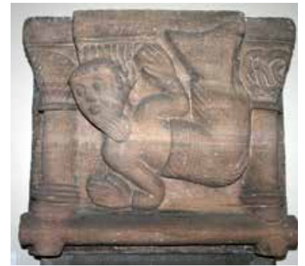
10 - « Triton ». Alspach (Haut-Rhin), abbatale. Console conservée à Colmar, musée d'Unterlinden