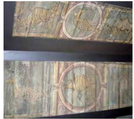
14 - Plafond peint ( partim ) provenant de l'ancien hôtel canonial de Voué (c. 1220). Metz, Musée de la Cour d'Or. (Cl. P. Brimbert, Gohy).

Comme on sait, les sirènes furent aussi évoquées en tant que symboles des tentations funestes auxquelles le chrétien, tel Ulysse, doit résister. Mais c'est sans doute en tant que monstre « familier » qu'elles marquèrent sans doute le plus les esprits.