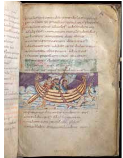
4 - Le Christ apaisant la tempête. Psautier de Stuttgart (Corbie?, premier quart du IX e s.). Stuttgart, Württembergische Landesbibliothek, Cod. bibl. fol. 23, fol. 124r.