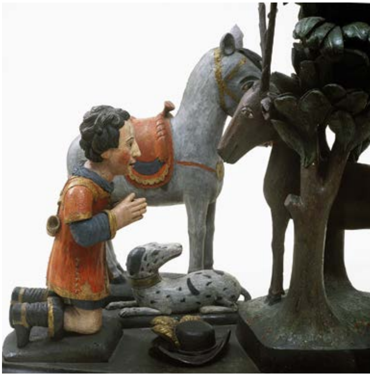
8 — Statue en bois polychrome évoquant la conversion de saint Hubert, conservée aux Musées de Verviers