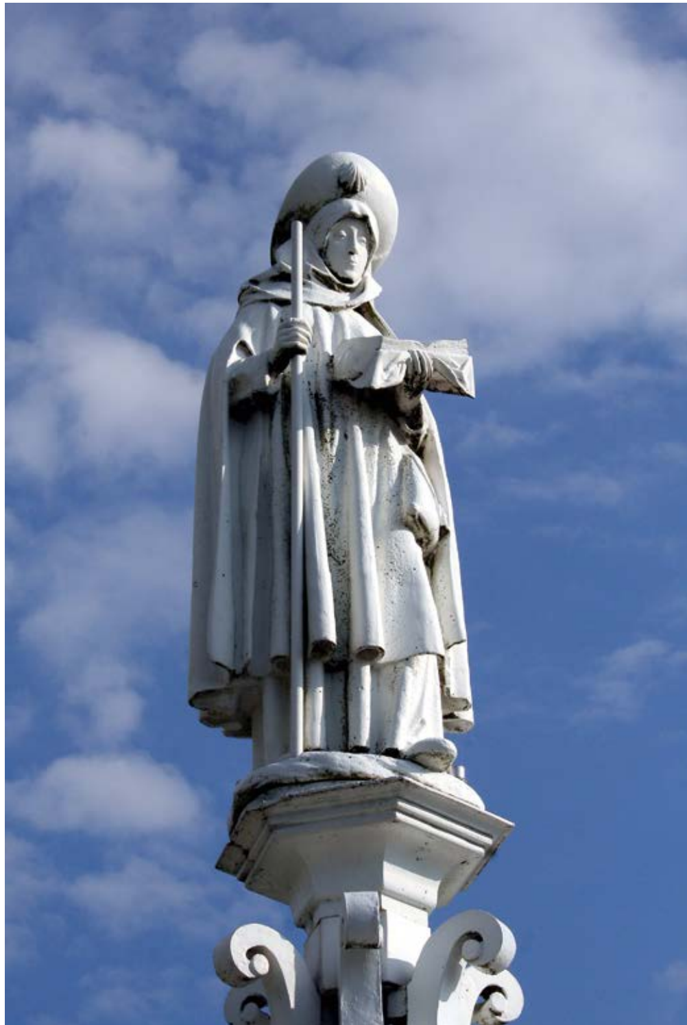
16 — Statue de sainte Renelde, reposant sur un monument-fontaine à Saintes, aujourd'hui dans l'entité de Tubize