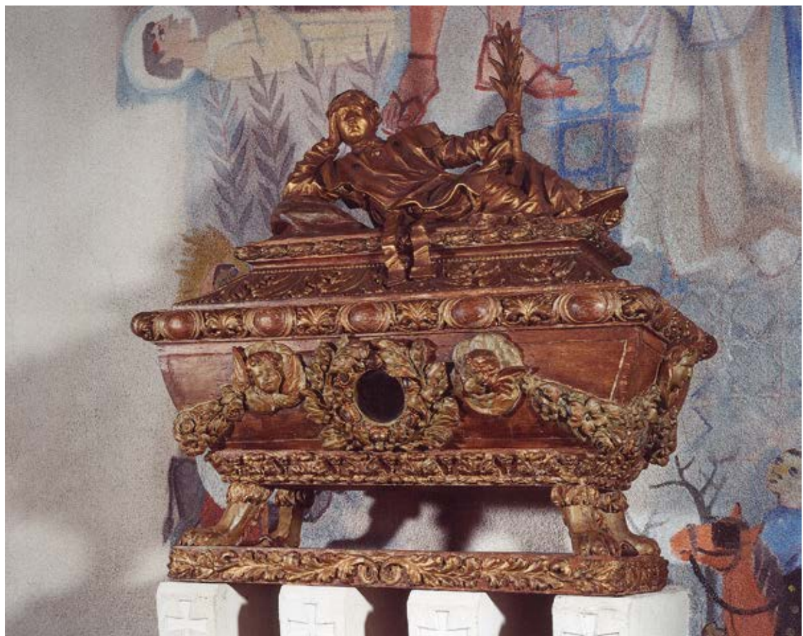
9 — Châsse de saint Monon, conservée en la collégiale Saint-Monon à Nassogne