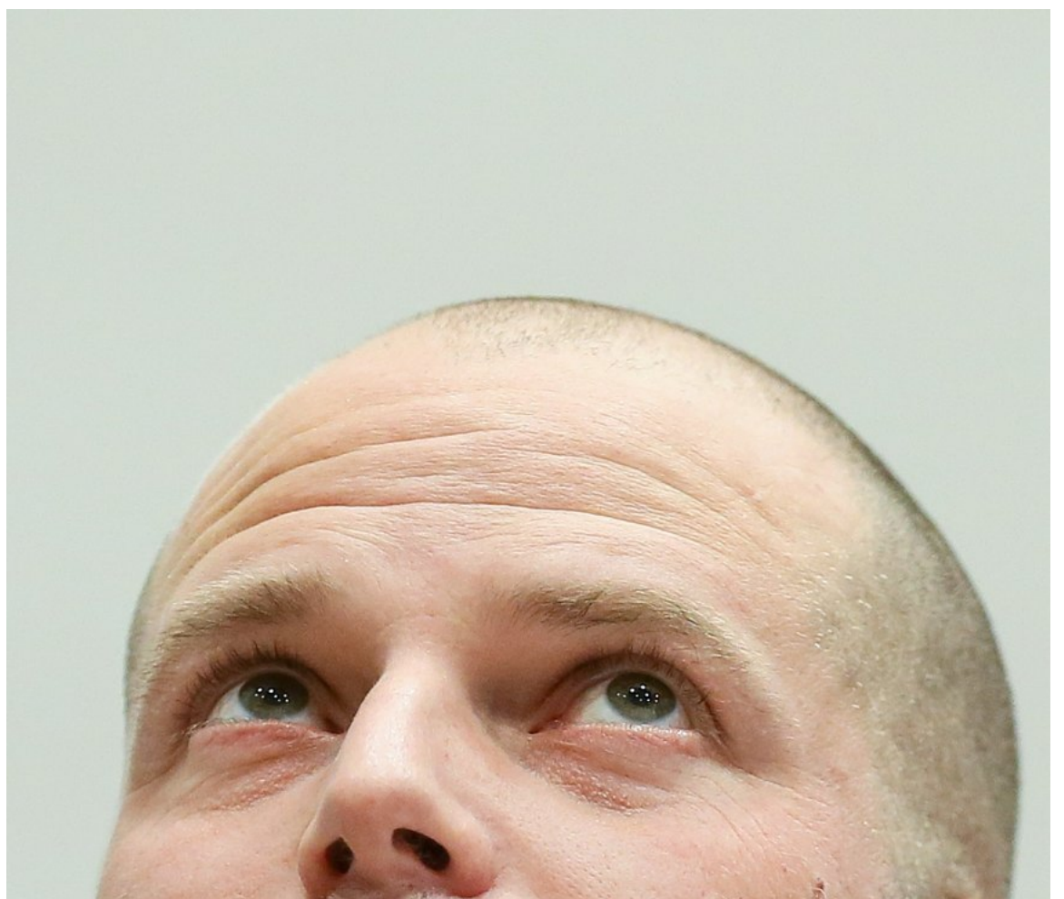
Theo Francken: sterk en autoritair, en dus aantrekkelijk voor PTB-kiezers.