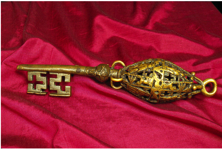
Clé de saint Hubert (XII e -XIII e siècles) conservée à Liège.