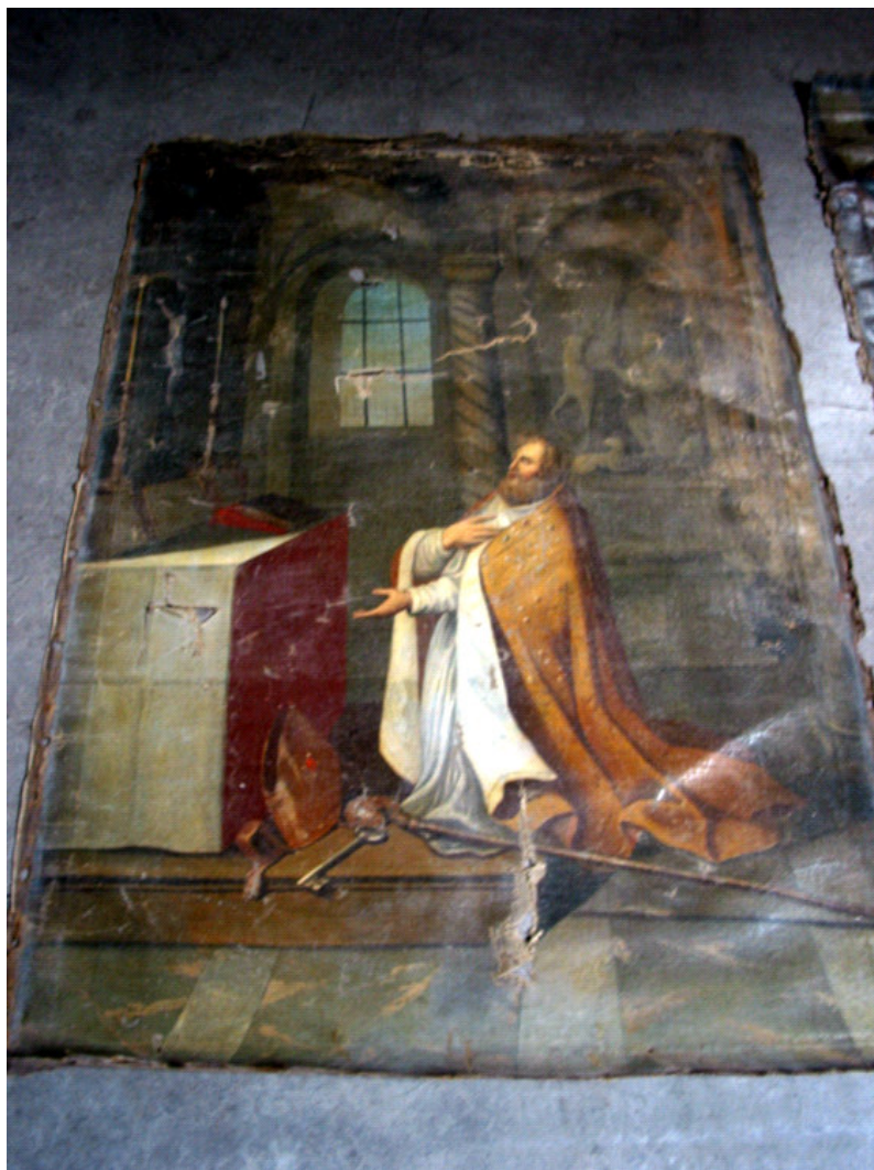
Appel à mécénat : Toile de saint Hubert priant dans la crypte de Saint-Pierre À restaurer...voir ci-dessus

Enfin, un appel a été lancé pour sponsoring et mécénat. Un seul exemple est cette peinture du XVIII e siècle de saint Hubert priant dans la crypte de Saint-Pierre, que nous souhaiterions faire restaurer (frais 2 000 €).