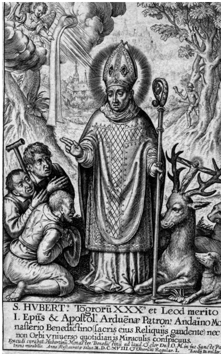
Jean Valdor, Saint Hubert évêque bénissant les malades , gravure au burin, 1618, Trésor de Liège.

Les mêmes textes des environs de 1100 font également allusion à la place d'Hubert dans la protection de la chasse en forêt d'Ardenne. Le livre II des Miracula (II, 15) précise ainsi que, si l'abbaye bénéficie de droits de chasse particuliers, c'est parce que saint Hubert, avant de devenir évêque, était un chasseur émérite :