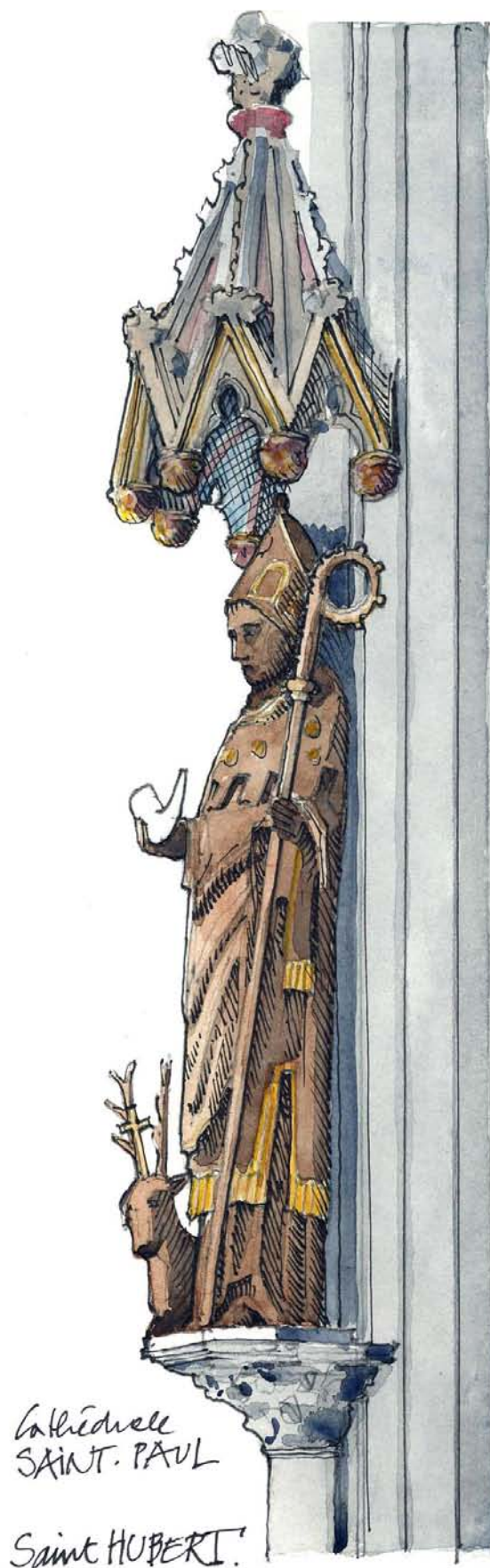
Dessin de Gérard Michel.

Afin d'être informé de toutes les activités du Trésor, inscrivez-vous à la newsletter sur le site www.tresordeliege.be