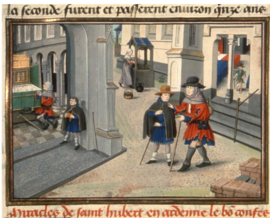
Hubert le Prévost, Vie de saint Hubert , Bruges, 1463 Pèlerins au tombeau de saint Hubert David Aubert (cop.) et atelier de Loyset Liédet (min.)

Peu de temps après la rédaction du récit de Jonas, un premier recueil de Miracles est constitué par un auteur anonyme des années 850. Dans ce recueil sont consignés huit miracles,