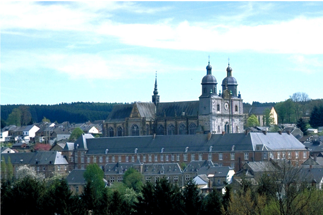
Basilique Saint-Hubert, Saint-Hubert, province du Luxembourg.