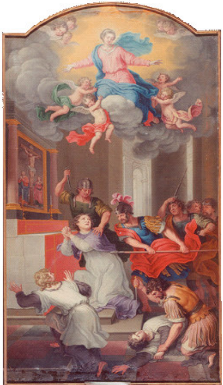
Englebert Fisen, Martyre de saint Lambert , 1693. Liège, Musée de l'Art Wallon.

Hubert meurt dans sa résidence de Fura , probablement Tervueren, dans la forêt de Soignes, au diocèse de Cambrai ; son corps est solennellement ramené à Liège. Son fils Floribert lui succède comme évêque.