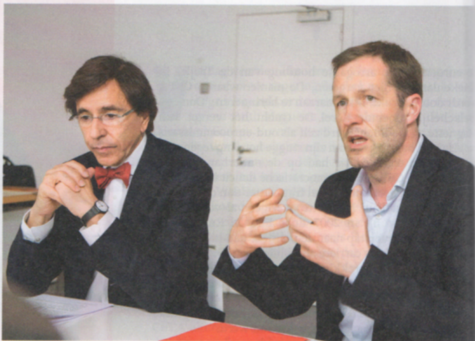
Het was Elio Di Rupo die Magnette en de kameraden aanmaande om vol voor het verzet te gaan.

Is het verzet van Magnette in de eerste plaats principieel? Europees president