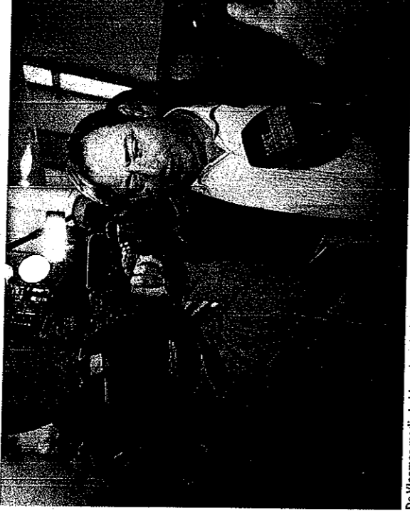
De Vlaamse media hebben de nota-De Wever gunstig ontvangen, de Franstalige partijen niet.

Schilder MICHAËL BORREMANS bewondert de moed van zijn minder getalenteerde collega's (in De Morgen).